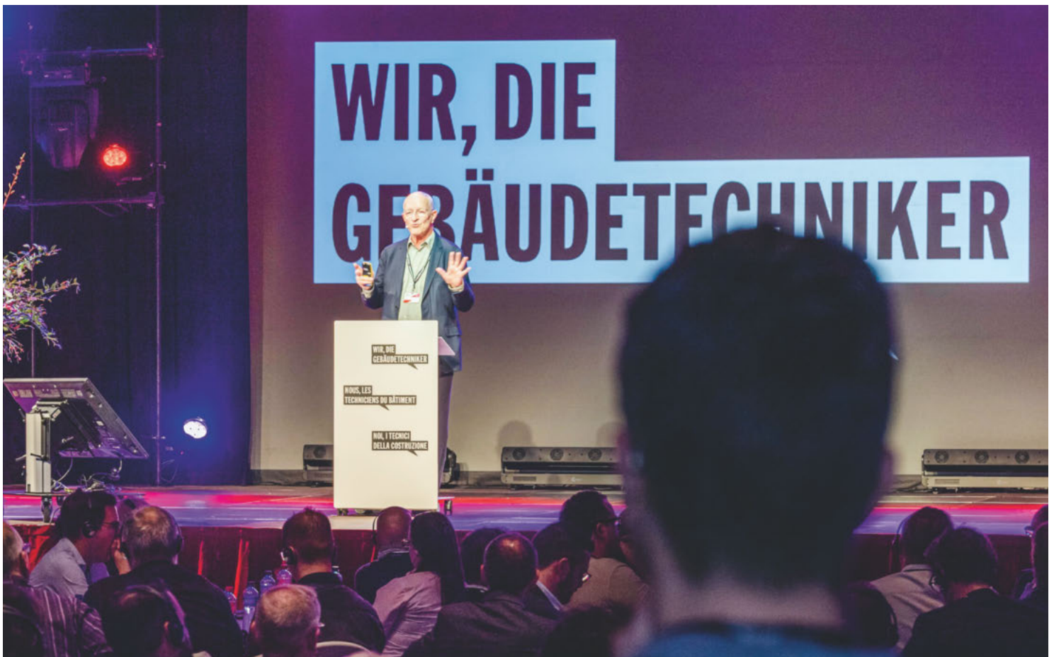
Cap sur l'espace avec Claude Nicollier.

Les participants ont pu profiter d'un séminaire varié, combinant thèmes d'actualité, réseautage et divertissement. L'hygiène des installations aérauliques, BIM2Field ou encore le programme « chauffez renouvelable » : voilà quelques-unes des nombreuses thématiques abordées par les intervenants. Claude Nicollier, premier Suisse dans l'espace, et Massimo Rocchi, comédien, ont quant à eux apporté une pincée d'aventure et une pointe d'humour à cette journée. <