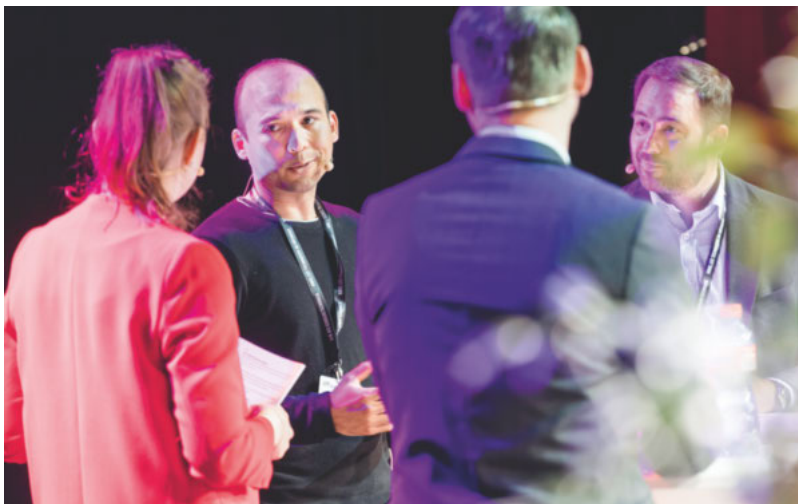
Table ronde sur le recrutement des apprentis.