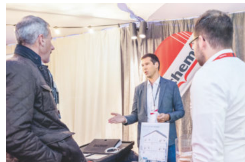
Echanges et innovations à l'exposition technique.

Les participants ont pu profiter d'un séminaire varié, combinant thèmes d'actualité, réseautage et divertissement. L'hygiène des installations aérauliques, BIM2Field ou encore le programme « chauffez renouvelable » : voilà quelques-unes des nombreuses thématiques abordées par les intervenants. Claude Nicollier, premier Suisse dans l'espace, et Massimo Rocchi, comédien, ont quant à eux apporté une pincée d'aventure et une pointe d'humour à cette journée. <